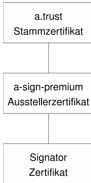
Abbildung 1: Zertifizierungshierarchie

Abbildung 1 zeigt eine schematische Darstellung der Zertifikatshierarchie.